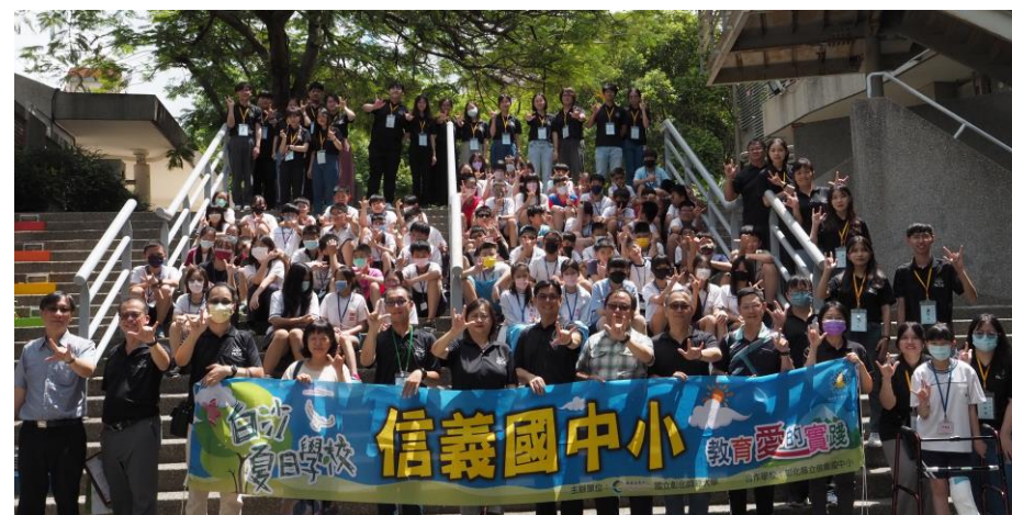
白沙夏日2週擬真校務教學實踐教育愛