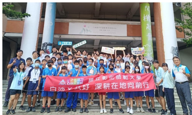
白沙x共好營隊多元型態服務偏鄉學校