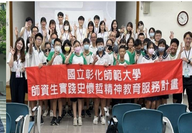
史懷哲計畫長期駐點偏鄉學校